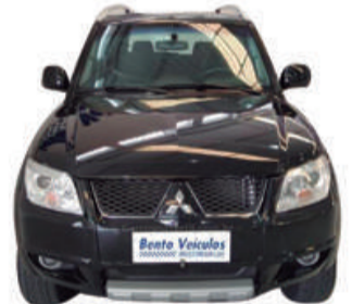
PAJERO TR4 2.0 4x4 16V 140CV FLEX 4P AUT. 2012 | PRETA