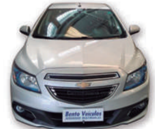
ONIX 1.4 MPFI LTZ 8V FLEX 4P MANUAL 2016 | PRATA