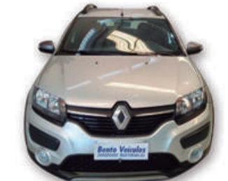
SANDERO 1.6 STEPWAY RIP CURL 8V FLEX 2016 | PRATA