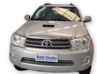
HILUX SW4 3.0 SRV 4x4 7 LUGARES 16V AUT. 2011 | PRATA