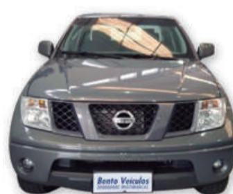
FRONTIER 2.5 XE 4x4 CD TURBO 2012 | CINZA