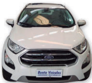
ECOSPORT 2.0 TITANIUM 16V FLEX 4P AUT. 2018 | BRANCA

Travessa Itaqui, 89, bairro Cidade Alta 54 3451 6660 | 54 99978 2615