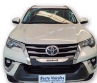
HILUX SW4 2.8 4x4 16V TURBO INTERCOOLER DIESEL AUT. 2020 | BRANCA