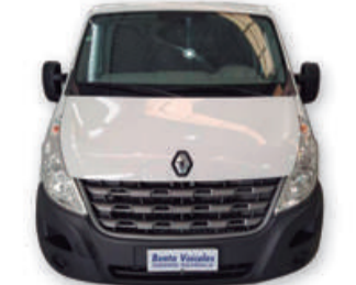
MASTER 2.3 FURGÃO L1H1 16V TURBO 2014 | BRANCA