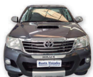
HILUX 3.0 SRV 4x4 CD 16V TURBO DIESEL AUT. 2012 | CINZA