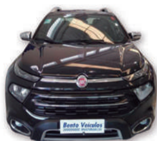
TORO 2.0 16V TURBO DIESEL RANCH AT 4x4 AUT. 2020 | PRETO