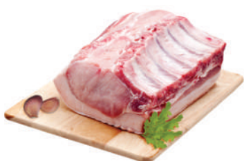
Carré suíno resfriado kg.