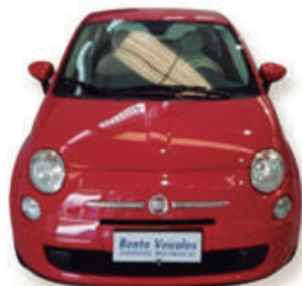
500 1.4 CULT 8V FLEX 2P 2012 | VERMELHO