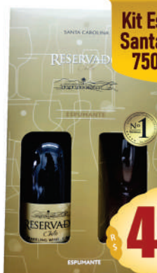
Kit Espumante Santa Carolina 750ml. Brut