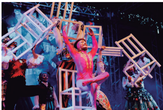
Grupo Tholl faz sua última apresentação na segunda-feira

também das 15h às 17h30 e das 19h30 às 21h30. Já o Carrossel, atração que neste ano novamente encanta a criançada, funciona