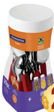
Faqueiro inox Tramontina Leme 20pc.