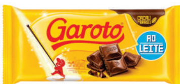
Chocolate Garoto 90g.