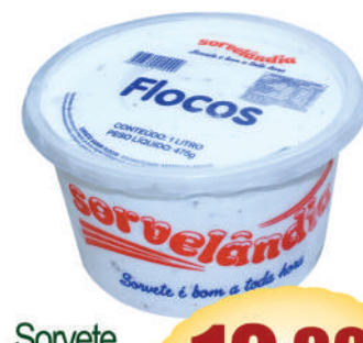
Sorvete Sorvelândia 1 litro.