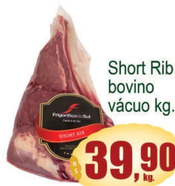
Short Rib bovino vácuo kg.