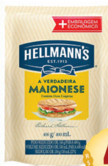
Maionese Hellmann's 400g. Sachet