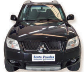
PAJERO TR4 2.0 4x4 16V 140CV FLEX 4P AUT. 2012 | PRETA