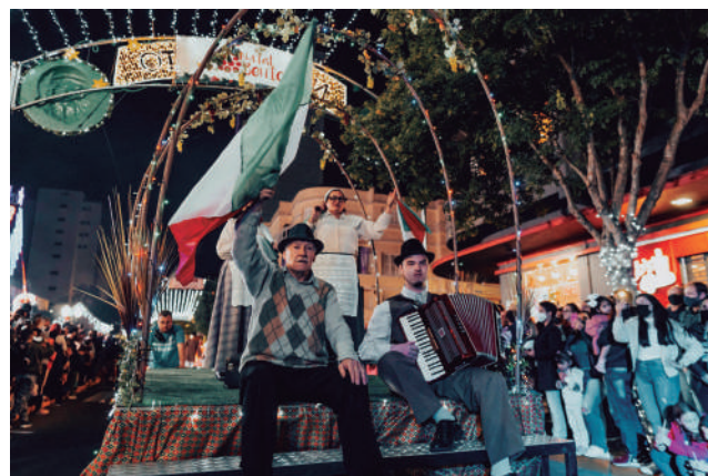
Buon Natale movimentou Via Del Vino neste sábado e na quinta-feira, 23/12

Na Via Del Vino, outras duas atrações são oferecidas à comunidade. A primeira é a Casa do Papai-Noel, que atende diariamente das 10h às 11h30 e das 15h às 17h30. Nas noites de shows, quintas, sábados e domingos, o papai-noel recebe