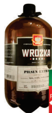
Cerveja Wrozka 2 litros.