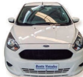
KA 1.0 SE 12V FLEX 4P MANUAL 2018 | BRANCO