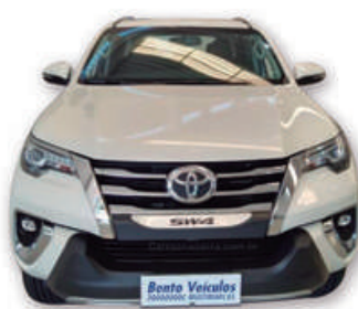
HILUX SW4 2.8 4x4 16V TURBO INTERCOOLER DIESEL AUT. 2020 | BRANCA