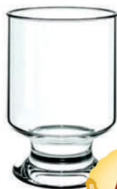
Copo Água Nadir 260ml. Casual