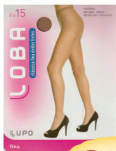
Meia loba clássica fina fio 15.