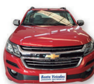
S10 2.8 LTZ 4x4 CD 16V TURBO DIESEL 4P AUT. 2019 | VERMELHA