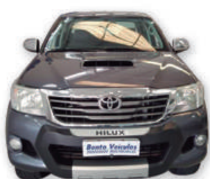
HILUX 3.0 SRV 4x4 CD 16V TURBO DIESEL AUT. 2012 | CINZA