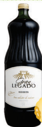
Suco de Uva Gran Legado 1,5 litro.