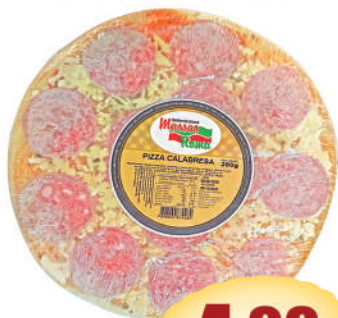
Pizza Roma 280g.