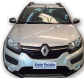
SANDERO 1.6 STEPWAY RIP CURL 8V FLEX 2016 | PRATA