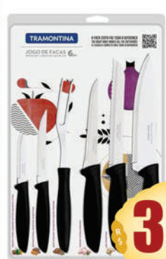
Jogo de facas inox Tramontina Plenus 6 pc.