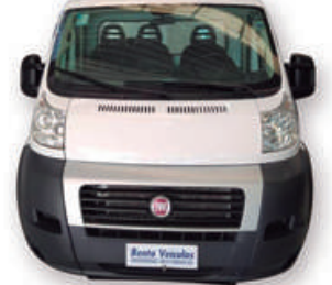
DUCATO 2.3 CARGO 8V TURBO DIESEL 2018 | BRANCA