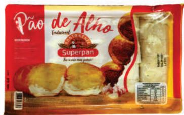
Pão de Alho SuperPan 350g. Tradicional

Ofertas válidas dia 17/12/2021, enquanto durarem os estoques. Fotografias ilustrativas. O desconto das promoções é dado diretamente no caixa. As ofertas aqui anunciadas não se aplicam para as compras online.