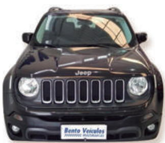
RENEGADE 2.0 16V TURBO DIESEL LONGITUDE 4x4 AUT. 2018 | PRETA

Travessa Itaqui, 89, bairro Cidade Alta 54 3451 6660 | 54 99978 2615