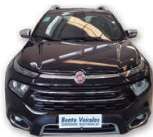
TORO 2.0 16V TURBO DIESEL RANCH AT 4x4 AUT. 2020 | PRETO