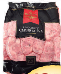
Linguiça suína Majestade kg.