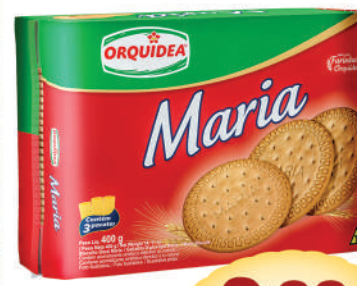
Biscoito Maria Orquídea 400g.