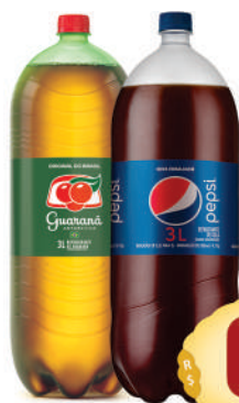
Pepsi ou Guaraná Antarctica 3 litros.