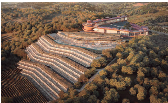
Dois resorts devem ser construídos em meio às videiras do Vale dos Vinhedos e, para o ano que vem, está previsto o lançamento do Gramado Park, parque gerenciado pela mesma empresa que comanda Snowland, em Gramado.

No entanto, o aumento significativo de turistas nos últimos anos começou a atrair os olhares de investidores gigantes com o objetivo de se instalar dentro da área vitivinícola. "Aí vem a preocupação, pois, em um primeiro momento, o Vale dos Vinhedos não teria infraestrutura adequada para suportar esses megaempreendimentos, principalmente em relação a rodovias, sem contar