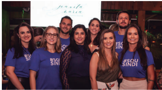
Edição 2020 movimentou Bamboo Lounge