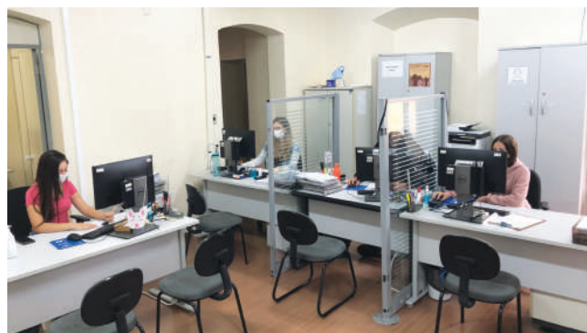
Procon BG também atende pelo WhatsApp (54) 3055-8547

Diante do aumento abusivo do preço dos combustíveis antes mesmo do reajuste entrar em vigor, órgão municipal autuou seis postos em Bento e recebeu cerca de 20 denúncias individuais