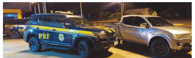
carro era clonado.

Com a L200 recém-adquirida, saíram para viajar. Entretanto, foram abordados na BR-386 por uma equipe da PRF, que descobriu que o