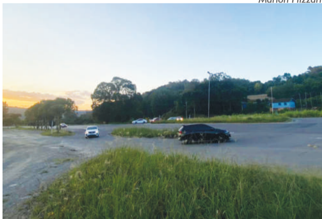
Acesso a Bento pelo trevo do Barracão deverá ter viaduto e rótula